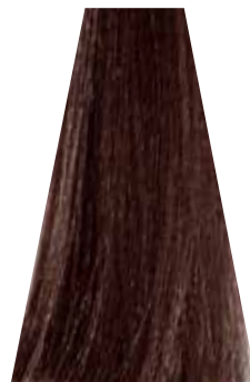
LIGHT COPPER BROWN castano chiaro rame châtain clair cuivré castaño claro cobrizo castanho claro acobreado