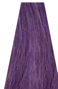
ORCHID orchidea orchidée orquídea orquídea