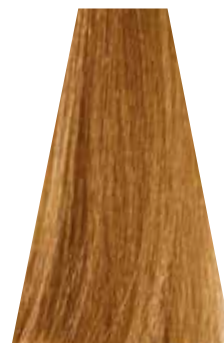
LIGHT WARM GOLDEN BLOND biondo chiaro dorato caldo blond clair doré chaud rubio claro dorado cálido loiro claro dourado intenso