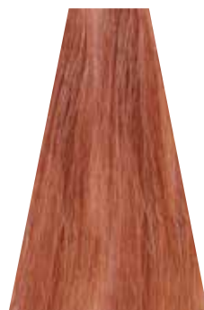
PEACH pesca pêche melocotón pêssego