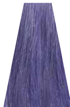
LAVENDER lavanda lavande lavanda lavanda