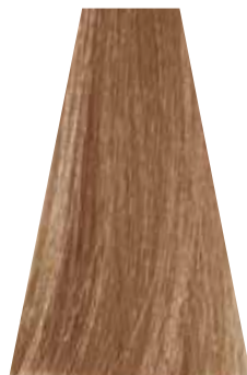
BEIGE BLOND biondo beige blond beige rubio beige loiro beige