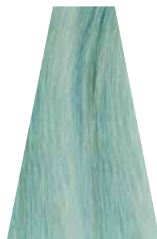
ICY BLUE blu ghiaccio bleu glacé azul hielo azul gelo