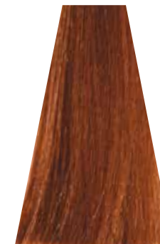
LIGHT COPPER GOLDEN BLOND biondo chiaro rame dorato blond clair cuivré doré rubio claro cobre dorado loiro claro acobreado dourado