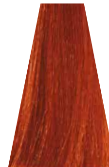
INTENSE COPPER MEDIUM BLOND biondo rame intenso blond moyen cuivré intense rubio medio cobre intenso loiro acobreado intenso