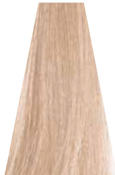
POWDER cipria poudre cipria powder