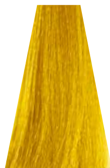
YELLOW giallo jaune amarillo amarelo