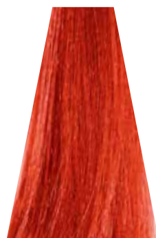
ORANGE arancio orange naranja laranja