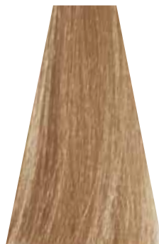
LIGHT BEIGE BLOND biondo chiaro beige blond clair beige rubio claro beige loiro claro beige