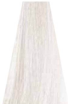
PEARL perla perle perla perola