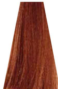
MEDIUM COPPER GOLDEN BLOND biondo rame dorato blond moyen cuivré doré rubio medio cobre dorado loiro acobreado dourado