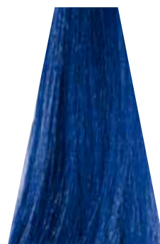
BLUE blu bleu azul azul