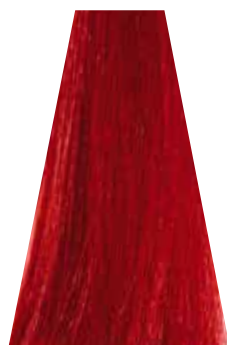
RED rosso rouge rojo vermelho