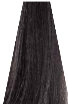
ANTRACITE antracite anthracite antracita antracite