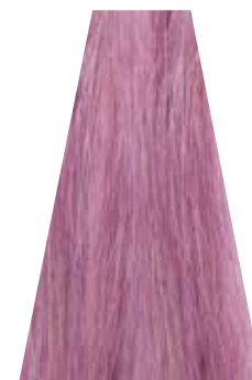
PINK GRAPEFRUIT pompelmo rosa pamplemousse rosé pomelo rosado toranja rosa