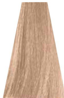
VERY LIGHT BEIGE BLOND biondo chiarissimo beige blond très clair beige rubio clarissimo beige loiro clarissimo beige