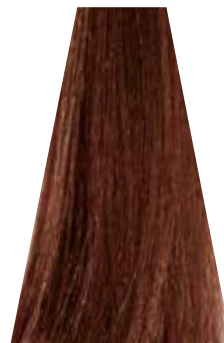
DARK COPPER GOLDEN BLOND biondo scuro rame dorato blond foncé cuivré doré rubio oscuro cobre dorado loiro escuro acobreado dourado