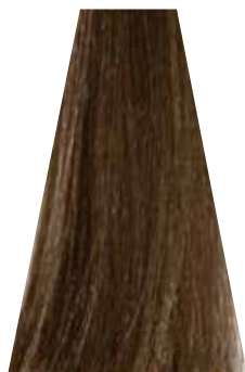
DARK GOLDEN BLOND biondo scuro dorato blond foncé doré rubio oscuro dorado loiro escuro dourado