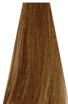
MEDIUM WARM GOLDEN BLOND biondo dorato caldo blond moyen doré chaud rubio medio dorado cálido loiro dourado intenso