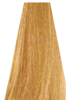
VERY LIGHT WARM GOLDEN BLOND biondo chiarissimo dorato caldo blond très clair doré chaud rubio clarissimo dorado cálido loiro clarissimo intenso