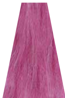
RASPBERRY lampone framboise frambuesa framboesa