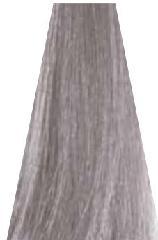
SILVER argento argent plateado prata