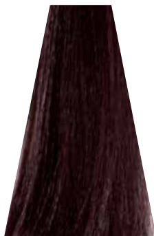
MEDIUM COPPER BROWN castano rame châtain moyen cuivré castaño medio cobrizo castanho acobreado